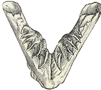
Fig. 32. Unterkiefer des Molchfisches Ceratodus Forsteri mit dem einzelnen Kammerzahn jederseits.

der beiden Flüßchen Burnett und Mary in Queensland in Australien; in vielen Büchern findet man statt des echten einheimischen Namens Djelleh für ihn die Bezeichnung „Barramunda“ oder „Barramundi“, es beruht das aber auf einer Verwechslung mit einem ganz anderen Fisch. Er besitzt ein eigentümliches Gebiß, nämlich in jeder Hälfte des Unterkiefers einen einzelnen großen Zahn mit hirschgeweihartigen Sprossen (Fig. 32), dem oben am Gaumen jederseits ein ähnlicher Zahn entspricht. Diese Bezahnung kam nun, als man den Queenslandler zuerst kennen lernte, den Paläontologen sogleich sehr vertraut vor, denn auf vollkommen ähnliche, nicht leicht mit einem andern Zahntypus zu verwechselnde Hirschgeweihzähne aus Trias- und Juraschichten hatte man längst eine fossile Fischgattung „Hornzahn“ oder Ceratodus getauft, und indem man jetzt das lebende Tier direkt der Gattung einreihete, besaß man mit hoher Wahrscheinlichkeit eine Ahnenreihe der Molchfische bis an den Anfang der Sekundärzeit zurück